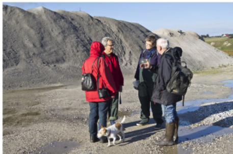
I Sårup Grusværk oktober 2012

Efter et par timers jagt sås på paraden et stort antal søpindsvin, flere havbænkebidere Palaega danica , flotte kiselsvampe, en god flinteblok med pæleorm og en ualmindelig flot søstjerne.