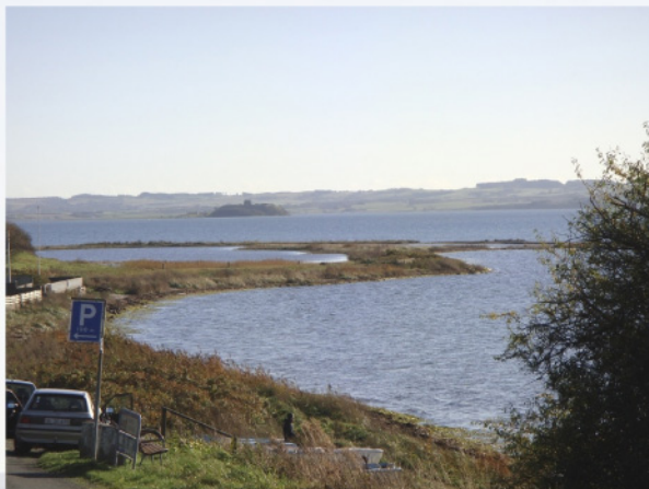
Mågeøens odder med Kalo i baggrunden

En masse flint og en masse murbrokker fra slottet – undertiden med dyre- spor og planteaftryk i teglen - ses hele vejen rundt.