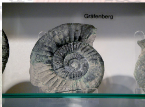
Find store ammonitter på turen!