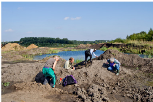
Lergraven ved Gross Pampau med ler og fossiler fra Sen Miocæn, ligesom i Gram.

Næste dag fortsatte vi 200 km nordpå til lergraven ved Gross Pampau med lag fra Sen Miocæn. I dejligt solskin spredtes gruppen her atter i alle retninger. Alt blev gennemført: nye graveområder, bredden af ældre vandfyldte grave samt nye og ældre opgravede bunker af ler. Og alle steder blev der gjort fund. Hovedsagelig af søtanden Dentalium badense , forskellige snegle og muslinger, især Astarte , heraf mange med borehuller foretaget af rovsnegle. Af mere spektakulære fund skal nævnes en tand, sandsynligvis fra en tandhval.