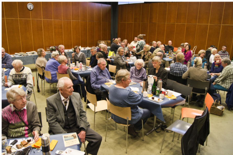
Der var stort fremmøde til klubbens 40 års arrangement

sted, men jeg ved, at mange mennesker i tidens løb har haft megen glæde af at arbejde der. Jeg vil også nævne ekskursionerne, hvor vi har et meget flot program med mange fine ture og socialt samvær.