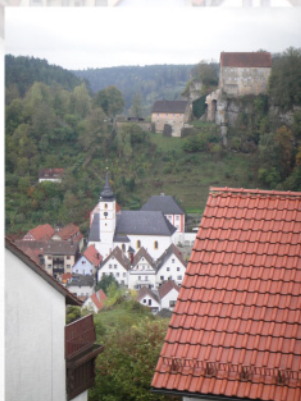
Motiv fra Pottenstein

Yderligere info: Ring 8635 2740 el. 5051 0055 til Linda Lægdsmand