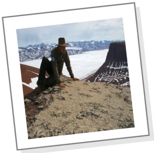
Foredragsholderen ved lagflade med fodspor

Kom og hør om hvordan ekspeditionen blev til, planlægningen, logistikken og valget af udstyr og ikke mindst kulminationen på det hele, de tre ugers fantastiske udgravning i Grønlands øde og barske landskab, hvor ikke mindre end tre velbevarede skeletter blev udgravet, sammen med en masse forstenede fodspor.