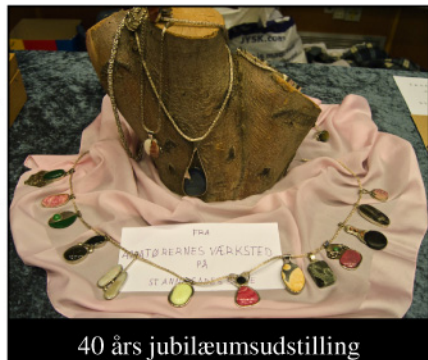
40 års jubilæumsudstilling