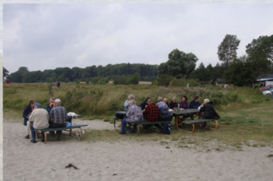
Det blev ikke varm mad den dag

Efter lidt hygge under halvtag skiltes vi - våde og en dejlig oplevelse rigere. Imponerende, at det stadig er muligt at overraske os med nye gode lokaliteter lige uden for døren.